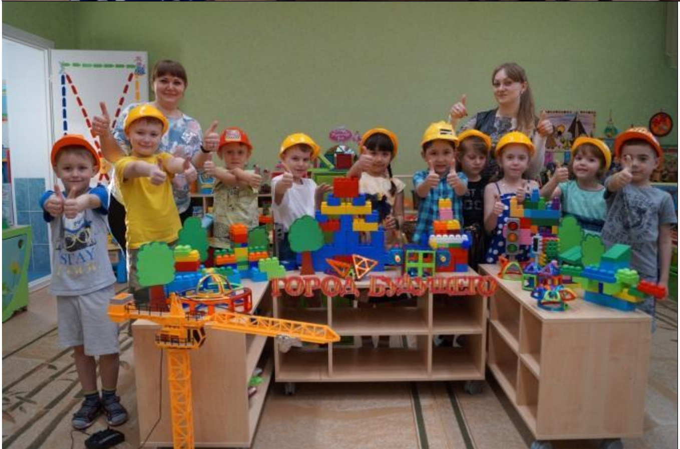
«Мама – инженер – строитель»