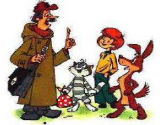
Право на тайну переписки