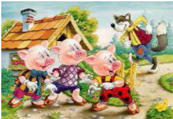
Право на защиту, право на неприкосновенность жилища