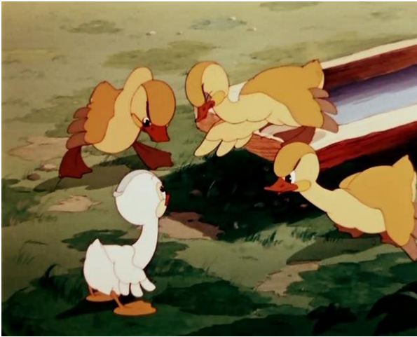
Право на уважение, гражданство