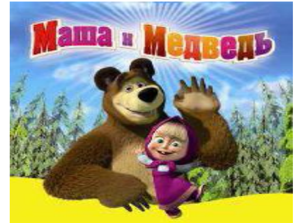
Право на дружбу с кем хочешь