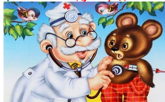
Право на получение медицинской помощи