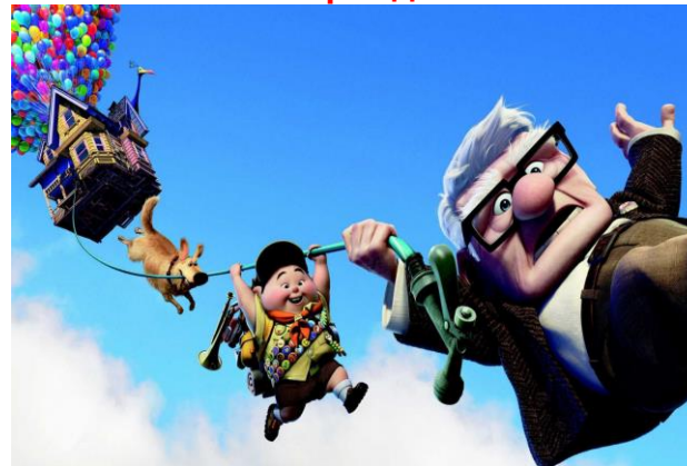
Право на свободу передвижения