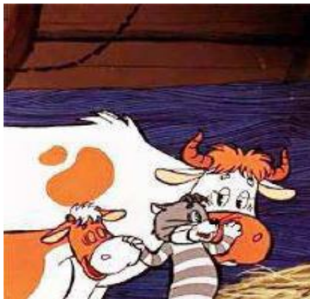
Право на имущество