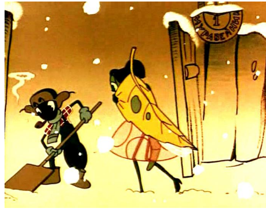
Право на труд и вознаграждение