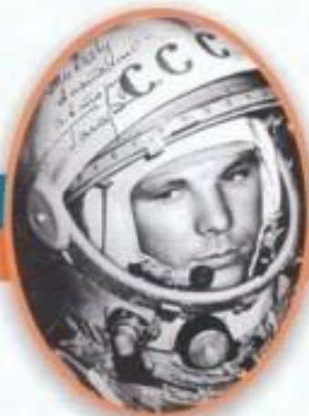
Юрий Алексеевич Гагарин Первый космонавт