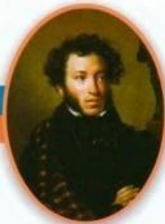
Александр Сергеевич Пушкин Великий русский поэт