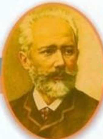
Петр Ильич Чайковский Великий русский композитор