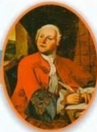
Михаил Васильевич Ломоносов Великий русский ученый

Ты, конечно же, вспомнишь, что Александр Сергеевич Пушкин написал много прекрасных стихов и чудесные сказки: «Сказка о царе Салтане», «Сказка о рыбаке и рыбке», «Сказка о мертвой царевне и о семи богатырях», «Сказка о золотом петушке». Петр Ильич Чайковский писал необыкновенно красивую музыку, создал цикл пьес «Времена года» и хорошо знакомый тебе «Детский альбом». Михаил Васильевич Ломоносов — великий русский ученый, он многого добился в самых разных областях знаний: литературе и искусстве, физике и астрономии, географии и истории. Им сделано много важных научных открытий. Юрий Алексеевич Гагарин был первым космонавтом, первым человеком, облетевшим на космическом корабле «Восток-1» нашу планету.